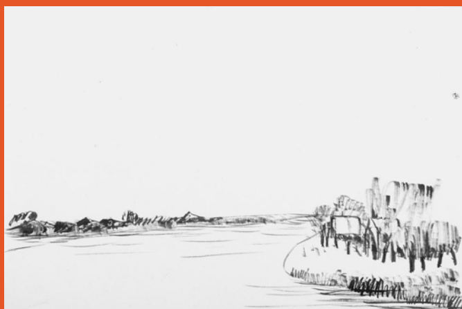
Henk Chabot 'Polderlandschap met vaart' (ca. 1946) Oost-Indische inkt op papier, collectie Chabot Museum Rotterdam